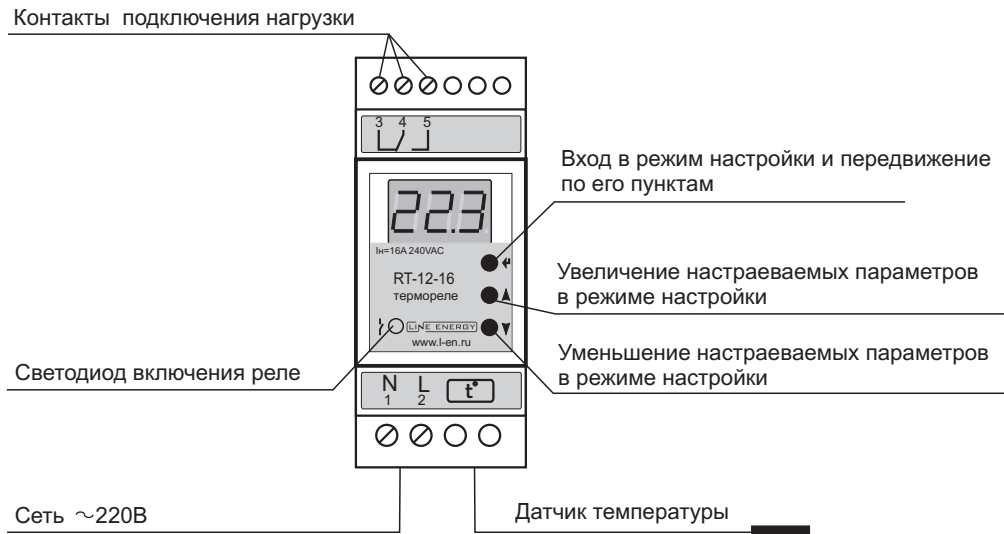
Рис 1. Устройство прибора

При понижении температуры на уровень гистерезиса контакты реле отключает охлаждающую установку, светодиод горит.