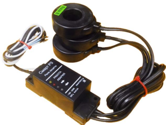
Цены на Смарт РЗ с учетом НДС 20 %: